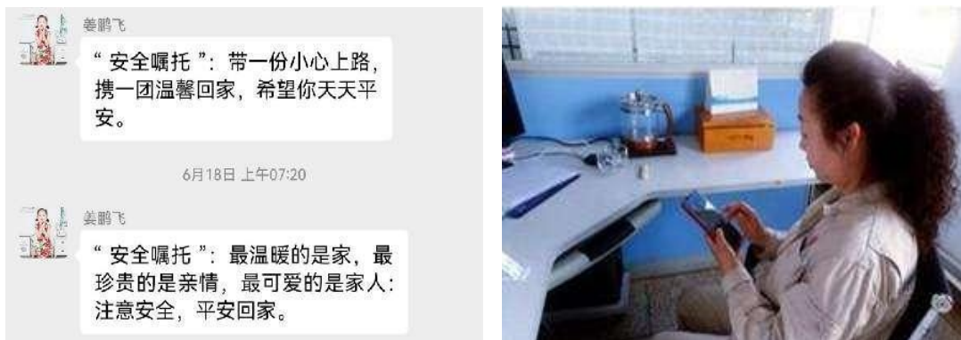
图6 开展“安全嘱托”传递活动

四是“安全嘱托”传递活动。为树牢一切风险皆可控，所有事故都能避免的安全理念，组织开展“安全嘱托”传递活动。期间共收集“安全嘱托”500 余条，通过收集、整理和筛选，每天将一些生动简练的“安全嘱托”通过企业、部门、班组三级微信群进行传递，进一步强化宣传效果，营造出“人人讲安全、事事讲安全、时时讲安全”的氛围，使全体员工逐步实现“要我安全”和“我要安全”的思想转变。