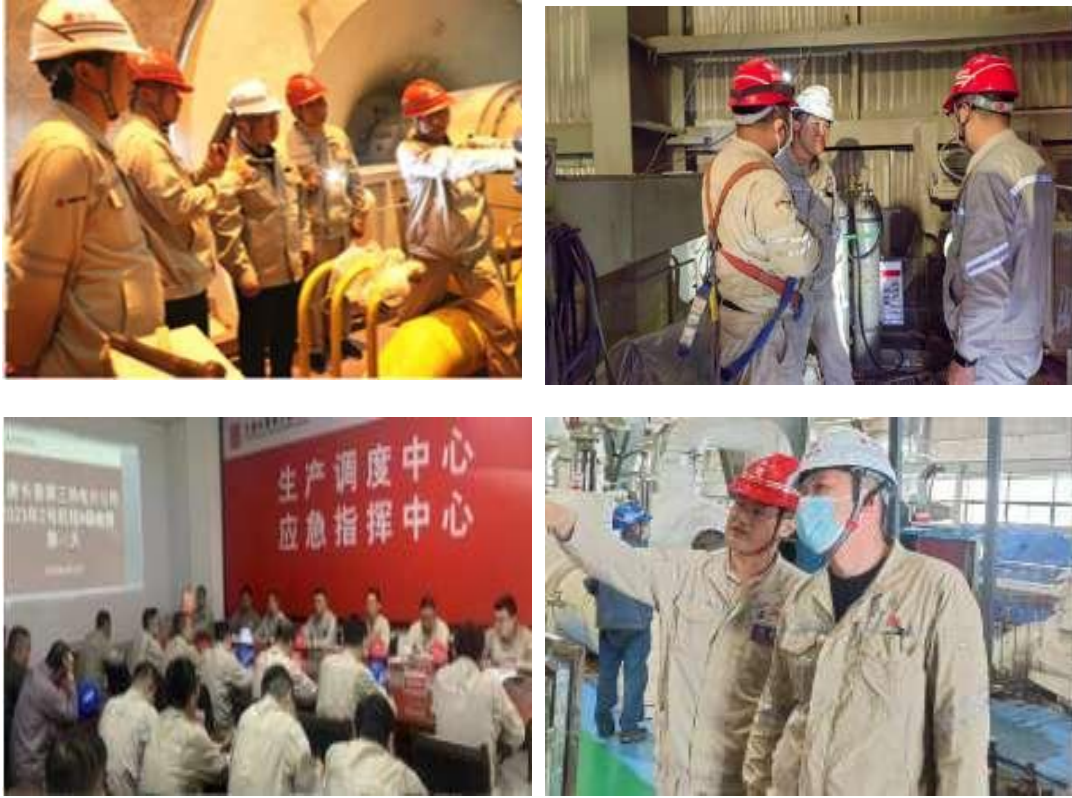
图 21 节日期间驻企盯守