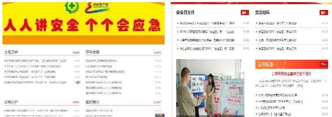
图 3 企业网站开辟活动专栏

宣传先进典型 12 个，通过集中报道和展示活动开展情况，营造浓厚的“安全生产月”活动氛围。