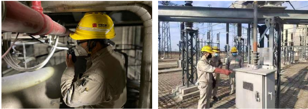
图 15 开展全员隐患排查

四是深刻吸取事故教训，第一时间传达落实习近平总书记对银川富洋烧烤店液化气爆炸事故重要指示精神、国资委紧急会议精神，组织系统各企业汲取宁夏“6.21”燃气爆炸事故教训，对照检查燃气、消防、防汛和防暑等工作，并做好端午节后上班的安全教育培训，确保安全生产局面稳定。