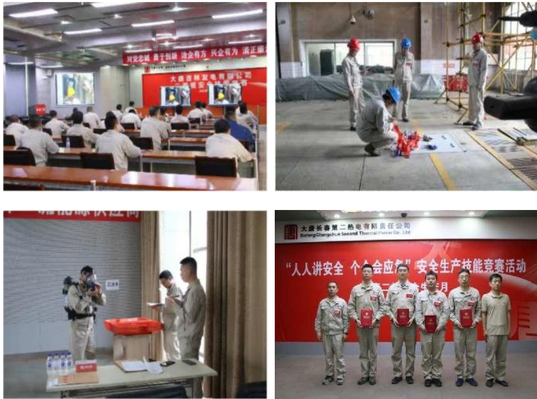
图 11 举办安全技能竞赛

实际操作环节共设置心肺复苏急救、正压式消防呼吸器使用、登高作业操作三项内容，参赛选手在比赛过程中不但巩固了安全知识，还锻炼了安全技能。