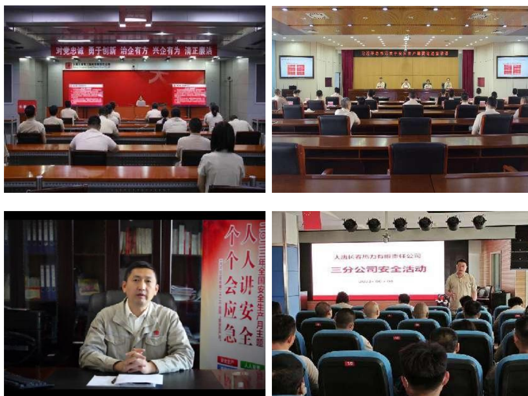
图2 各企业领导开展安全宣讲活动

致的讲解分析，阐释了习近平总书记关于安全生产重要论述和指示，对提升安全生产水平具有重要意义。安全月期间，各级企业负责人落实安全生产“第一责任人”法定职责，率先垂范，开展企业主要负责人“安全承诺践诺”、深入基层开展宣讲等活动，共开展《宣贯安全生产法》、《企业一把手讲安全》、《宣贯习近平总书记关于安全生产工作论述摘编》等宣讲活动 12 次，切实推动了学习贯彻工作走深走实。