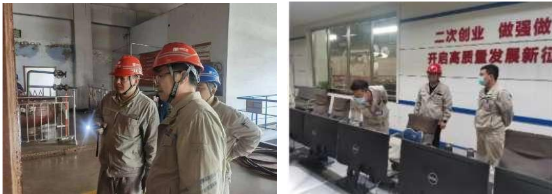
图 14 企业主要负责人带头开展重大事故隐患排查整治活动

二是推进企业主要负责人“五带头”活动，开展企业主要负责人带头开展重大事故隐患排查整治活动 21 次，参与人次 219 次；开展企业主要负责人带头开展高危作业安全风险排查整治 13 次，参与人次 118 次；开展企业主要负责人带头对外包外租等生产经营活动排查整治 14 次，参与人次 136 次；并定期督导、检查、落实考核，促进安全责任落地有声。