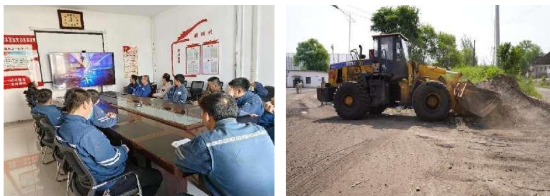
图 18 开展“遵章驾驶，平安行车”活动

组织个企业制定《内部车辆准驾管理办法》，组织车辆（包括公务车辆、厂内专用机动车辆、特种车辆、拉煤车等）驾驶员学习“新版机动车道路交规则”、观看“交通安全警示教育片——八大交通危险行为”，讲解车辆维护保养等知识，全面提高驾驶员知法守法意识和安全意识，养成遵章驾驶的自觉性，营造良好的交通安全氛围。