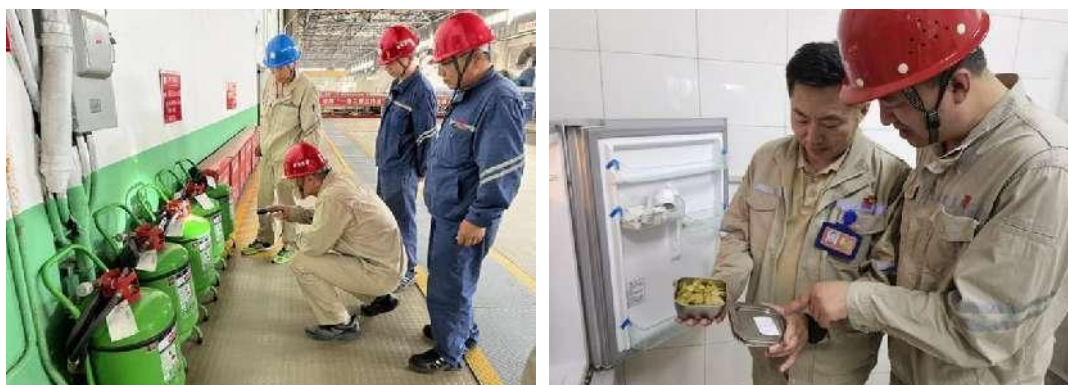
图 17 职工代表安全巡视