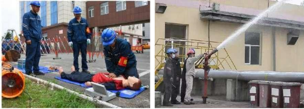
图 19 开展应急演练