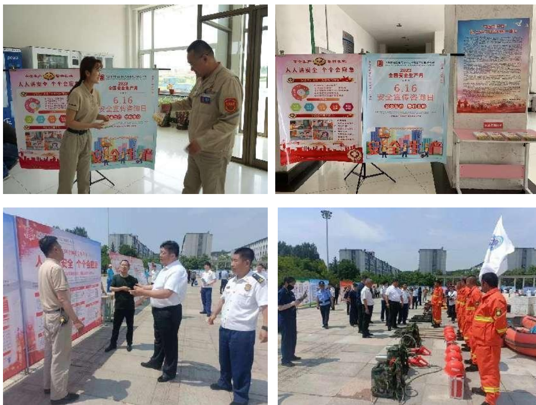
图7 开展“安全宣传咨询日”活动