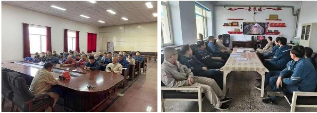
图8 结合案例开展专题学习讨论

二是明确工作面，整治角色混乱。根据职工岗位职责，开展全员岗位专项培训，列出清单，在工作中做到不缺位、不越位；通过倒查作业视频监控，查找不同岗位之间角色、界面不清，职责交叉问题，形成清单，逐项整治；利用现场+视频监控相结合的方式，集中整治操作监护人参加操作、工作监护(负责)人不全程监护等问题。