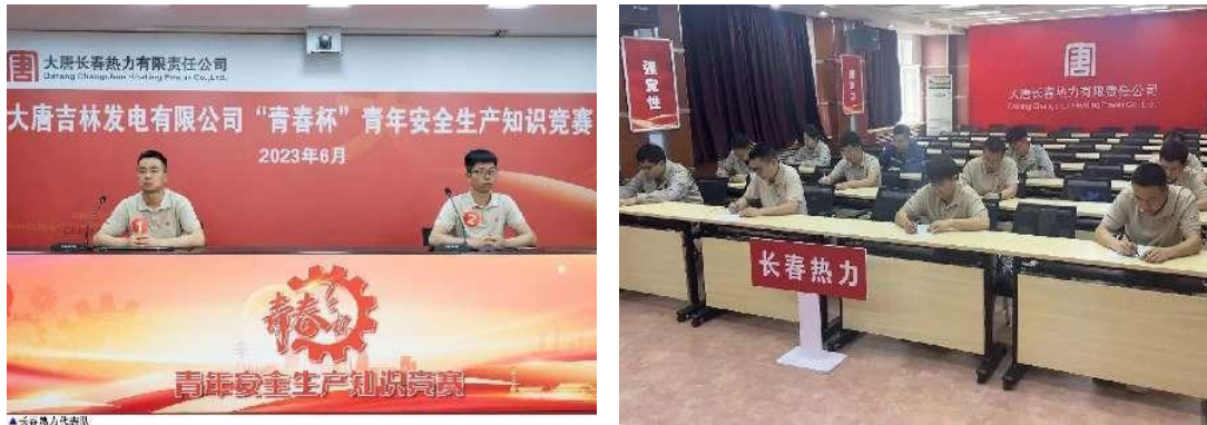
图9 “青春杯”青年安全生活参知识竞赛

答题、网上对抗、风险题三个环节，全面考验参赛选手掌握安全生产知识水平的熟练程度。在对抗环节中特别增设观众互动答题，200余名观众扫描二维码积极参与，身临其境感受选手们答题的紧张氛围。比赛过程中，播放了企业自编自演的3部安全短视频，以寓教于乐的形式，紧扣“人人讲安全，个个会应急”主题，宣传安全生产知识。