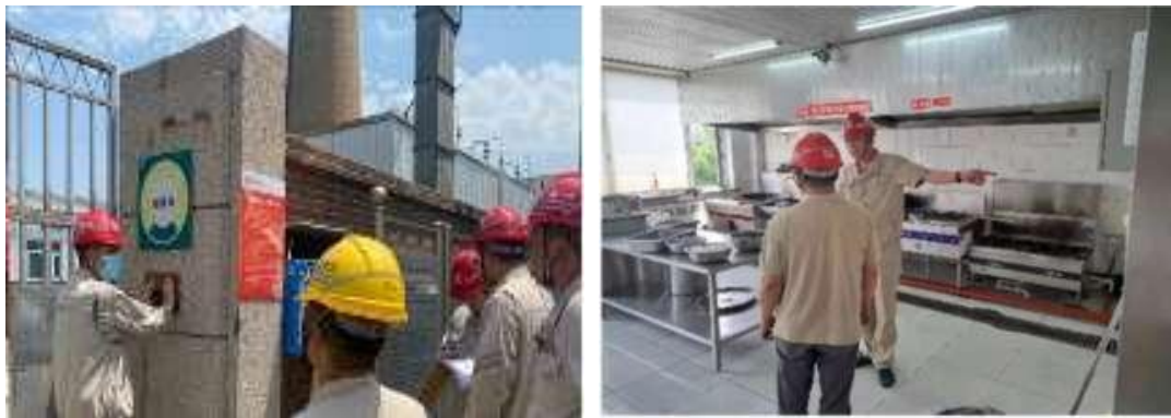
图 16 开展火灾隐患排查

四是深刻吸取事故教训，第一时间传达落实习近平总书记对银川富洋烧烤店液化气爆炸事故重要指示精神、国资委紧急会议精神，组织系统各企业汲取宁夏“6.21”燃气爆炸事故教训，对照检查燃气、消防、防汛和防暑等工作，并做好端午节后上班的安全教育培训，确保安全生产局面稳定。