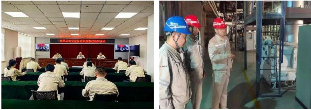
图 13 开展安全督查及风评外审工作发现问题“回头看”

二是推进企业主要负责人“五带头”活动，开展企业主要负责人带头开展重大事故隐患排查整治活动 21 次，参与人次 219 次；开展企业主要负责人带头开展高危作业安全风险排查整治 13 次，参与人次 118 次；开展企业主要负责人带头对外包外租等生产经营活动排查整治 14 次，参与人次 136 次；并定期督导、检查、落实考核，促进安全责任落地有声。