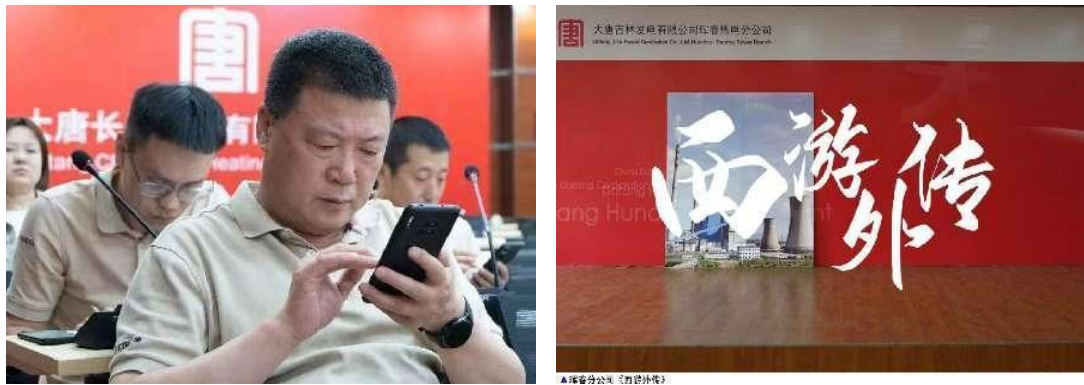
图10 选手和观众线上答题、安全短视频展播

二是开展二季度安全技能竞赛。6月21日，成功举办大唐吉林公司二季度安全技能竞赛，竞赛设置了理论考试、视频查违章、实际操作三个模块，共五个项目。视频查违章环节以精心制作的违章作业小视频为题目，选手根据制作的违章影像资料，来分析判断违章具体内容、性质、类别、数量，