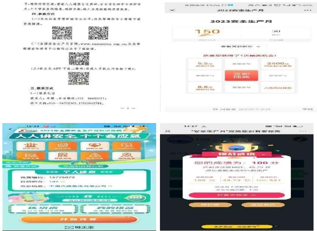
图 12 参加网络知识竞赛