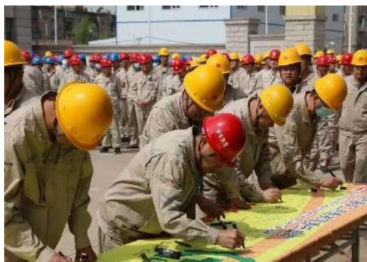
图1 全面启动“安全生产月”活动